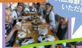
沢山海鮮を いただきました