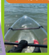
アクティビティ組