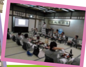
素敵な景品が 貰えました☆