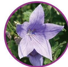
青紫の桔梗は「友情」