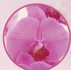
ピンクの胡蝶蘭は「あなたを愛しています」