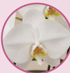
白い胡蝶蘭は「清純」