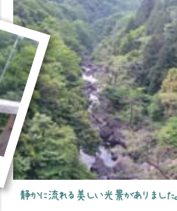
静かに流れる美しい光景がまりました。