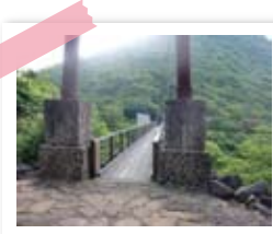
つり橋を渡ってみることにしました!