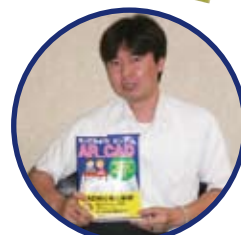
著者・開発責任者 荒木さん