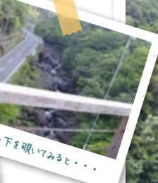
恐る恐る下を覗いてみると...