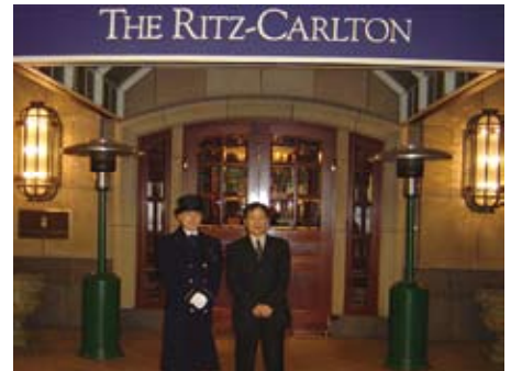
ドアマンの方とにっこの社長。