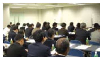
さきさきに座っていただいた東京会場