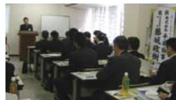
岡山会場も皆様とても熱心