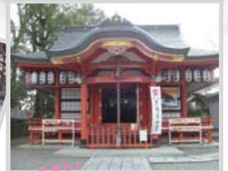
御霊神社の ハトさん